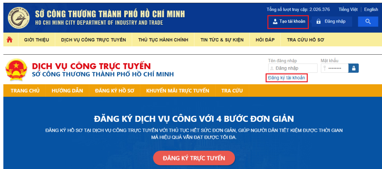
Hình 1: Chọn chức năng “ Đăng ký tài khoản ”

Bước 1: Truy cập địa chỉ http://congthuong.hochiminhcity.gov.vn (hoặc http://congthuong.hochiminhcity.gov.vn/web/dvc ) , chọn chức năng “ Tạo tài khoản ” để tạo tài khoản và nộp hồ sơ trực tuyến