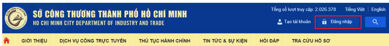
Hình 1: Chọn chức năng “ Đăng nhập ”

Truy cập địa chỉ http://congthuong.hochiminhcity.gov.vn (hoặc http://congthuong.hochiminhcity.gov.vn/web/dvc ) , chọn chức năng “ Đăng nhập ” để đăng nhập vào phần mềm