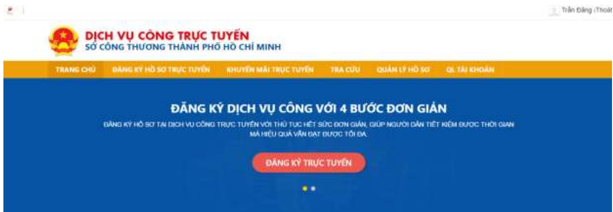
Hình 11: Đăng nhập thành công

Như vậy Quý khách đã hoàn tất việc tạo tài khoản để sử dụng Dịch vụ công trực tuyến của Sở Công Thương thành phố Hồ Chí Minh.