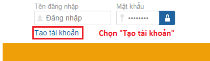
Hình 2: Chọn “Tạo tài khoản”