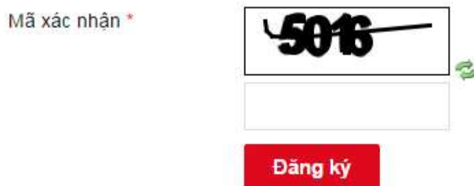
Hình 6: Nhập mã xác nhận và chọn nút “Đăng ký” để hoàn tất.