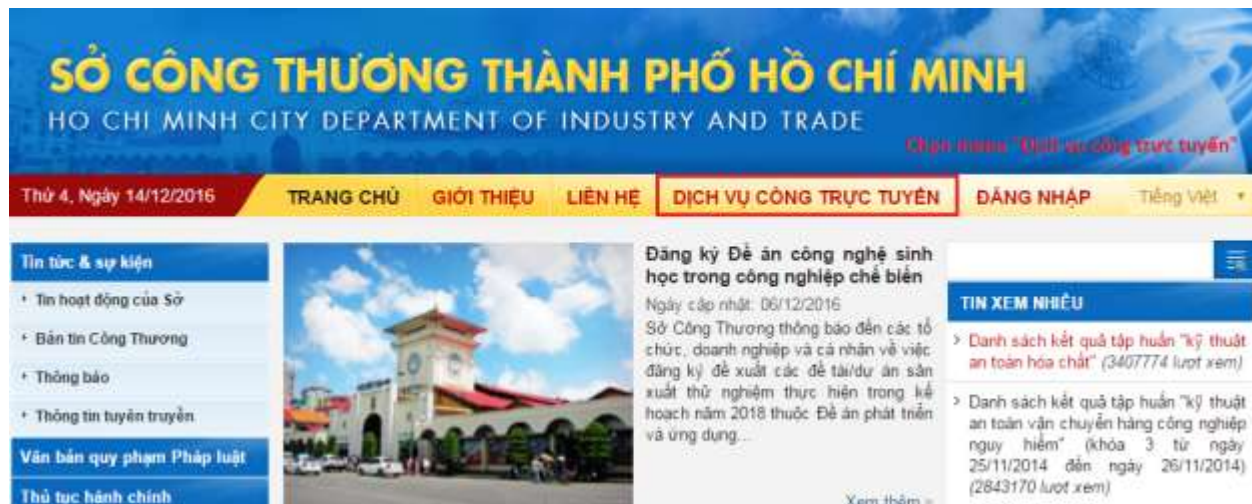
Hình 1: Truy cập menu “Dịch vụ công trực tuyến”