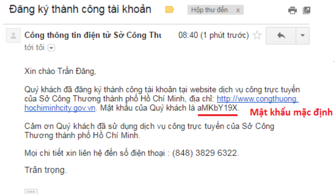
Hình 7: Mật khẩu mặc định